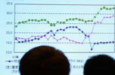
中国の主要経済指標の推移 (前年比、%)

注: 最新(四半)は、10/1-3の消費者物価指数の前年比です。 出所: 中国国家统计局資料、中国海關総局資料、CEIC Data(中国の経済)、中国のGDP半期(10月2日時点)